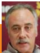
Joan Carretero President de Reagrupament

No ens podem cansar: aquesta és una tasca que ens ha tocat i que no podem defugir, malgrat alguna vegada puguem tenir la temptació de deixar-ho, en pensar que ja hem fet prou. La llibertat del nostre País bé es mereix aquest esforç. Hem avançat molt, cal rematar. El futur és a les nostres mans.