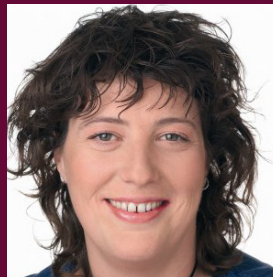
Teresa Jordà - Cap de llista de la coalició per Girona