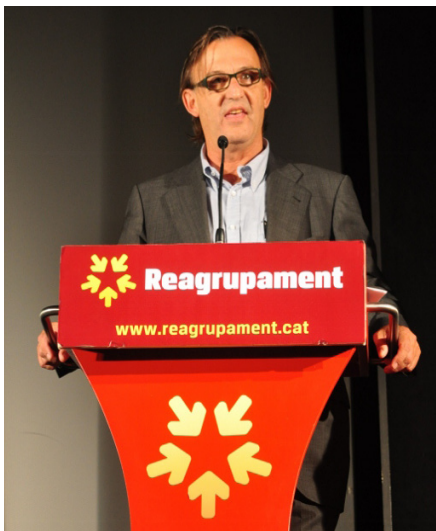
L'alcalde de Vic, Josep M. Vila d'Abadal, anunciant la creació de l'Assemblea de Municipis Independentistes a la IV Assemblea de Rcat

que està rescatant Espanya de la ruïna econòmica, en lloc de deixar d'enviar diners a la metròpoli madrilenya perquè els rebenti en AVEs, subvencions i funcionariat