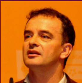
Alfred Bosch - Cap de llista de la coalició per Barcelona